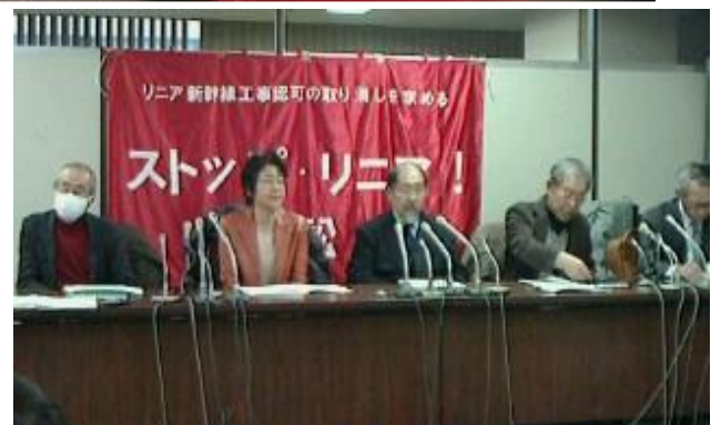
（司法記者クラブでの記者会見）