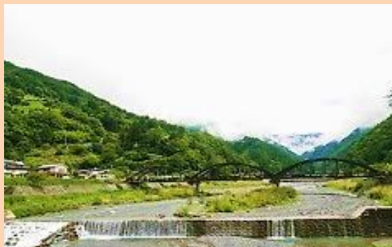
2016年8月 大鹿村

私たちは昨年5月、国交大臣のリニア工事認可の取消を求めて738人が原告となり、東京地裁にストップ・リニア！訴訟を起しました。裁判では、リニア沿線各地で起きている、またこれから起こるであろう深刻な事態について原告の意見陳述が続いています。提訴から1周年を記念して、リニアの不要性と危険性を改めて考える講演会&シンポジウムを開催します。リニアに関心を持つ多くの方の参加をお待ちしています。