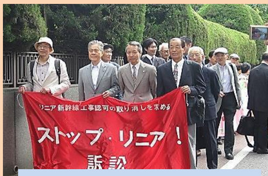
2016年5月20日 東京地裁に提訴