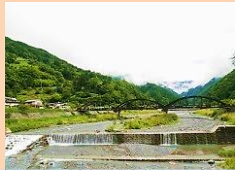
2016年8月 大鹿村

私たちは昨年5月、国交大臣のリニア工事認可の取消を求めて738人が原告となり、東京地裁にストップ・リニア！訴訟を起しました。裁判では、リニア沿線各地で起きている、またこれから起こるであろう深刻な事態について原告の意見陳述が続いています。提訴から1周年を記念して、リニアの不要性と危険性を改めて考える講演会&シンポジウムを開催します。リニアに関心を持つ多くの方の参加をお待ちしています。