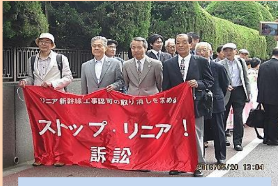
2016年5月20日 東京地裁に提訴